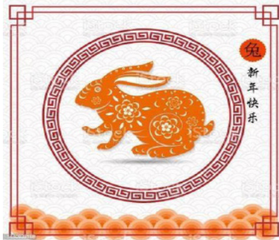
Grafik zum Chin. Neujahr des Kaninchens 2023