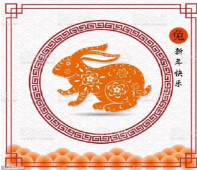
Grafik zum Chin. Neujahr des Kaninchens 2023