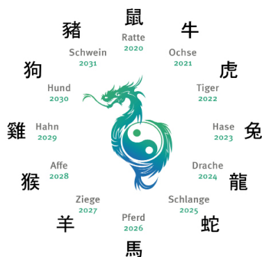
Die 12 Chin. Tierkreiszeichen der Jahre 2020 bis 2031. Grafik (c) bei Ursula C. Brunner, München

HASEN , welche heuer ihren 60. Geburtstag feiern (Jahrgang 1963), wird ans Herz gelegt, in diesem Jahr besonders auf sich aufzupassen und mit den eigenen Kräften eine gute Work-Life-Balance zu schaffen. Regelmäßige Erholung und Entspannung werden sehr empfohlen.